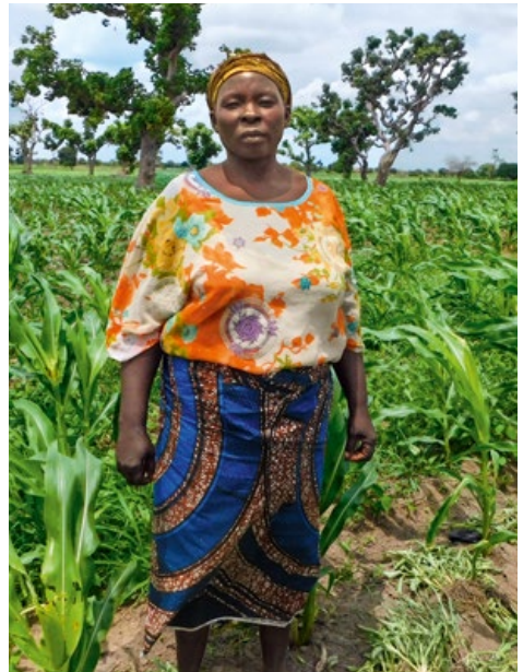
Erfolgreicher Maisanbau – eine stolze Landwirtin vor ihrem Feld.

Das hat Folgen: Gesetze und Programme zur Förderung der Ernährungssicherheit ignorieren oder unterschätzen häufig die Rolle von Frauen. Dadurch wird ein großes Potenzial verschenkt – denn solange Frauen nicht die gleichen Chancen wie Männer